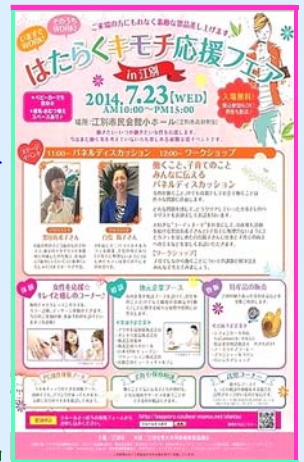
写真は、当日の会場の様子とポスター

場内エポックのブースは、会員6名が交互に案内役を務め、4台のノートパソコンを並べ、PC操作に関心ある来場の女性に、数種類のタイピング練習ソフトなどを体験して頂き、働きたい女性のスキルの一助になる事を願いました。当日は、朝から雨模様で足もやや鈍く感じましたが、お昼頃には来場者も増え、エポック始め、各ブースも賑わいを見せました。エポックも、この様に各方面へ出向いて市民との交流を広げる事は意義多く、大切な一面と感じたイベントでした。（文責：たけうち）